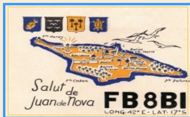
FB8BI de 1952 à 1958

Devant le risque financier, Ségolène Royal a finalement plié et s'est exécutée trois jours après le prononcé du jugement.