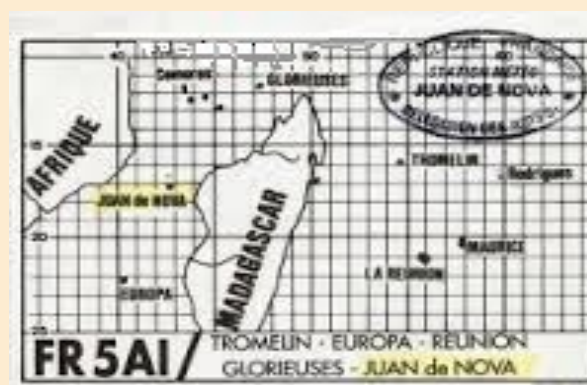
Activité de 1991