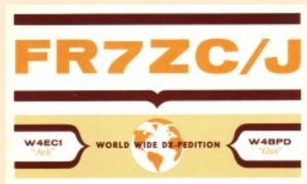
FR7ZC/J expédition de 1963