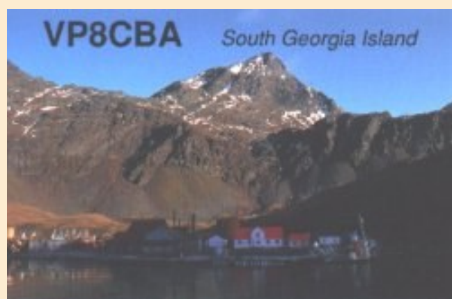
Expédition d'avril 1992