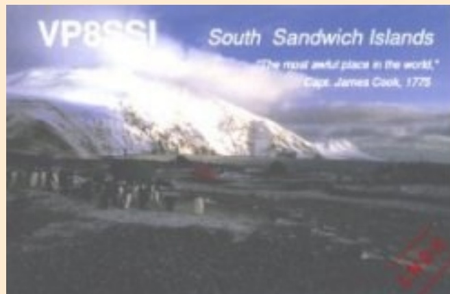
Expédition de mars 1992