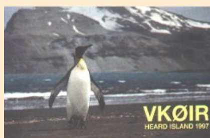
Activité de 1997