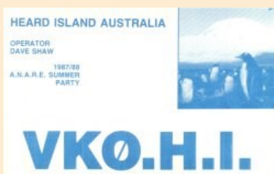
Activité de 1987 / 1988