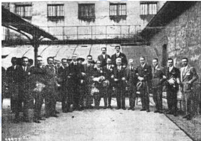
La délégation française