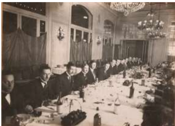
Dîner de gala à l'hôtel Littré Paris

L'association est représentée à la Commission Interministérielle de la T.S.F, et, est consultée officiellement par l'administration des P.T.T, lors de l'élaboration des décrets régissant la T.S.F.