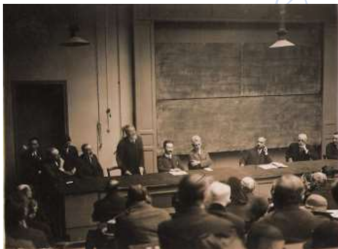
Amphithéâtre de la Sorbonne 1925, M. le Général Ferrié prend la parole