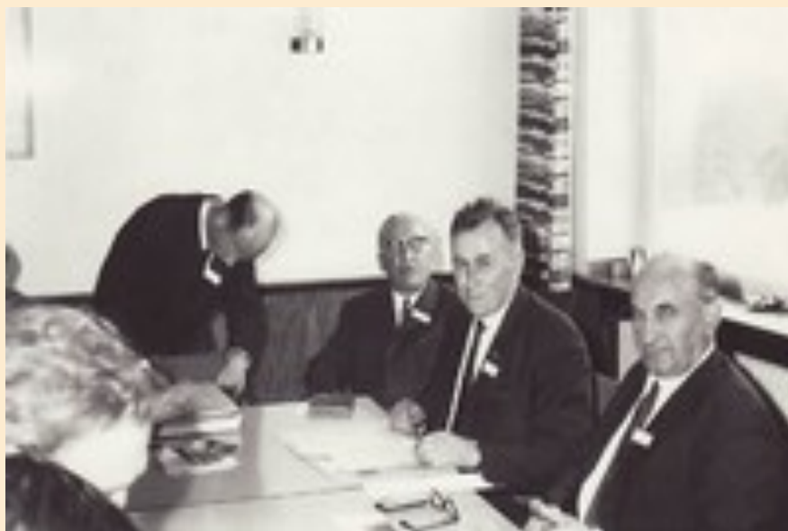
Réunion FIRAC à Mainz en 1968 : à droite, de face, DJ1EG, F9AP et F9ZX