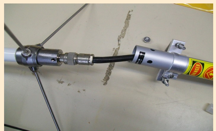
Une fois sur le toit faites passer le connecteur de votre câble coaxial dans le tube et connectez l'antenne.

Veillez à ne pas altérer la mousse qui entoure les selfs, elle a pour but de centrer l'antenne dans son tube de fibre de verre.