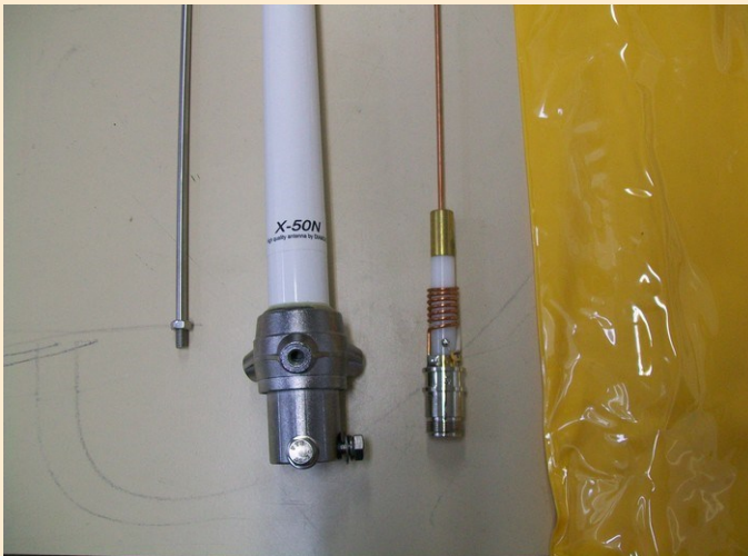
Gros plans; bas de l'antenne avec système LC vu précédemment, manchon en laiton connecté à un brin en cuivre.

Il est assez facile de la monter, posez les deux brides de fixation sur une table pour qu'elles ne soient pas désaxées. Insérez le tube et serrez les vis cruciformes.*