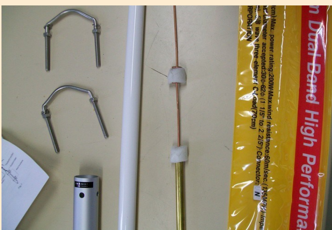
Haut de l'antenne; c'est la fin du cylindre en laiton, puis après quelques centimètres une nouvelle self.

Veillez à ne pas altérer la mousse qui entoure les selfs, elle a pour but de centrer l'antenne dans son tube de fibre de verre.