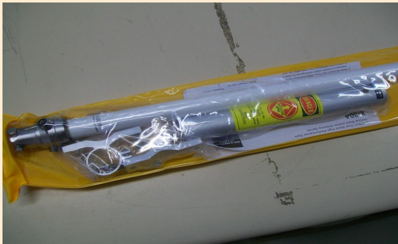
X50 sous blister