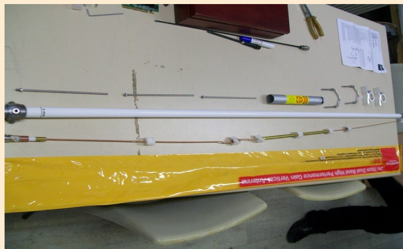
Totalité de l'antenne avec son ensemble de fournitures pour le montage