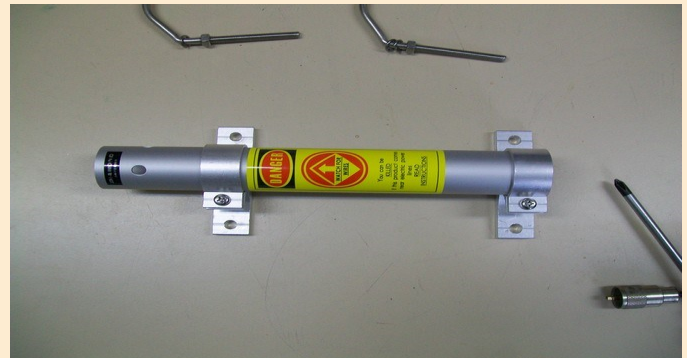
Serrez les radians à la main puis bloquez avec une clé de 8 et si possible pas trop fort.